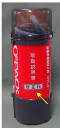
写真1. 修正版の 取扱説明書