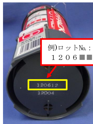
写真2. 製品底面 記載のロットNo.